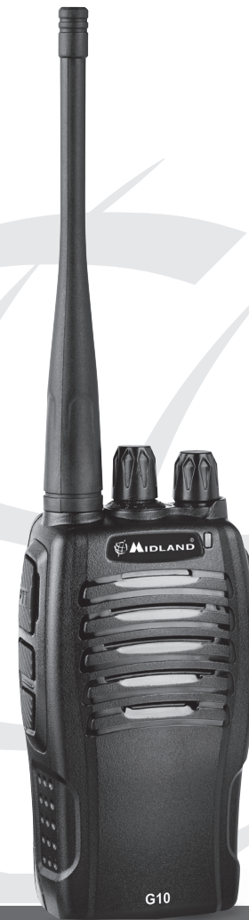
PMR446 TRANSCIVER |